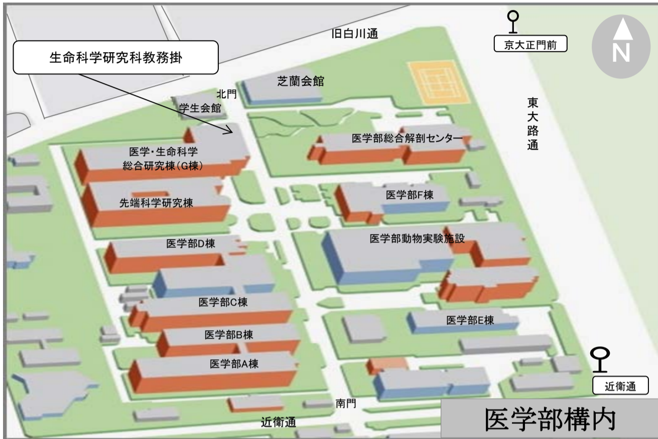
京都大学周辺略図